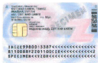
Zadní strana (s čipem)

Od 1. 1. 2012 je vydáván nový občanský průkaz se strojově čitelnými údaji (s čipem nebo bez čipu). Je vyroben ve formě plastové karty o rozměrech 54 mm x 85,6 mm (velikost platební karty), má gravírovanou černobílou fotografii a gravírovaný podpis držitele. Jméno, příjmení a číslo dokladu jsou provedeny taktilním gravírováním (lze poznat hmatem). Oba občanské průkazy jsou vzhledově stejné, liší se pouze tím, že na zadní straně je umístěn kontaktní elektronický čip.