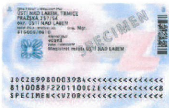
Zadní strana (bez čipu)